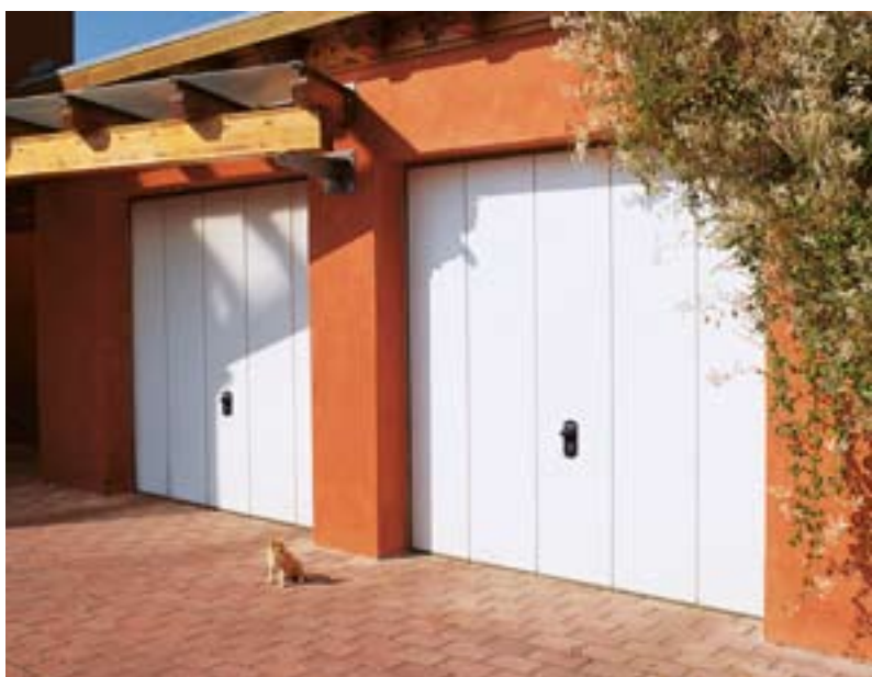
Oben: CLASSIC in Lichtgrau, ähnlich RAL 7035 Unten: ELEGANT in Verkehrsweiß, ähnlich RAL 9016

Einfach in der Bedienung, langlebig und ausgesprochen sicher: unsere klassischen Schwingtore setzen seit vielen Jahren Maßstäbe in Bezug auf funktionelle Perfektion, hohe Qualität und durchdachte Detaillösungen. Darüber hinaus bestechen Schwingtore durch ein hervorragendes Preis-Leistungsverhältnis.