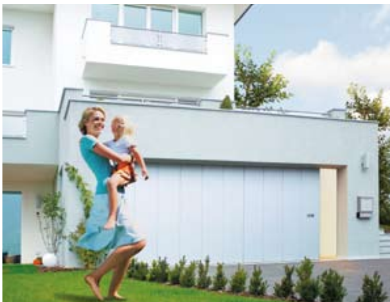
Oben: TOPFLAIR-ISO in Verkehrsweiß, ähnlich RAL 9016 Unten: TOPSTYLE-ISO in Lichtgrau, ähnlich RAL 7035

Familienfreundlich und platzsparend, sehr vielseitig und ebenso funktionell wie ästhetisch überzeugend: Normstahl-Seitensektionaltore sind etwas ganz Besonderes. Als Extra bieten diese Tore eine eigene Schlupftür-Funktion – so sparen Sie sich eine eigene Garageneingangstür.