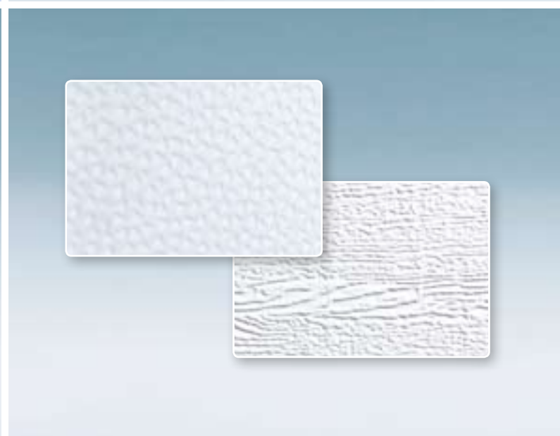
Oben: g60 STYLE in Verkehrsweiß, ähnlich RAL 9016 Unten: g60 STYLE Dekor hell, ähnlich Golden Oak