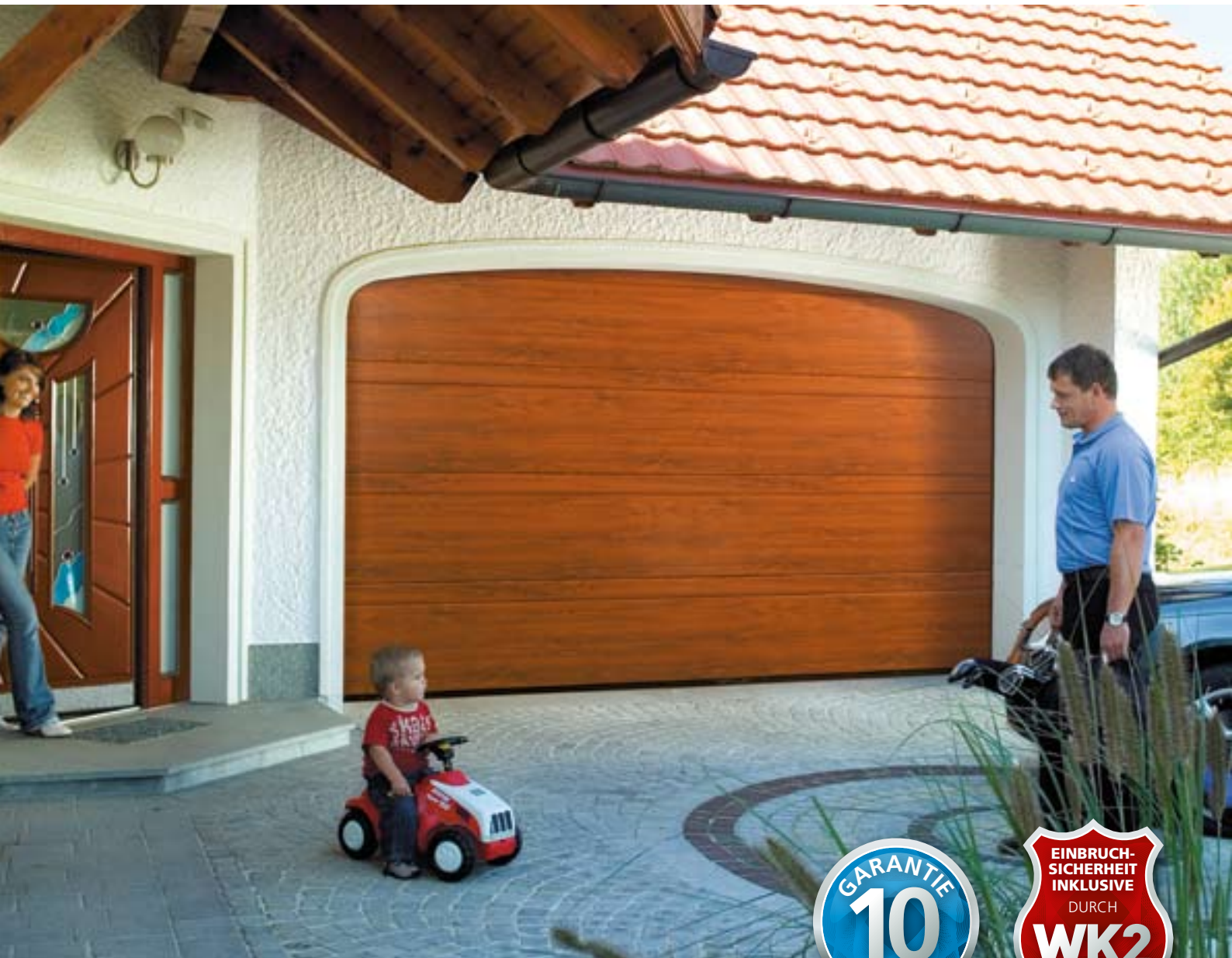
EUROFLAIR-ISO Automatik mit Dekor hell, ähnlich Golden Oak