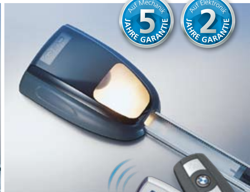
Torantrieb ULTRA Excellent